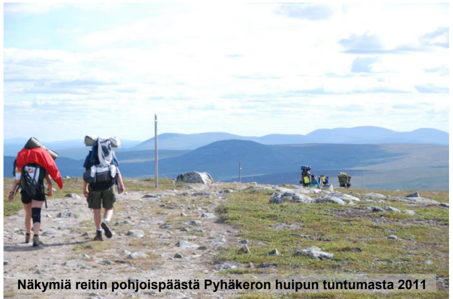
Näkymiä reitin pohjoispäästä Pyhäkeron huipun tuntumasta 2011