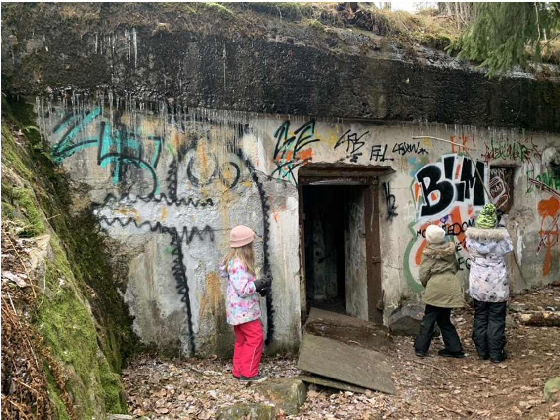
Kuva: Rastiradalla pääsi tutustumaan hyvin säilyneisiin sodan aikaisiin kalliosuojahuoneisiin

Radan vaativuus on vaihdellut ryhmittäin, tekniset haasteet ovat olleet ehkä ikävimpiä, mutta toisaalta onneksi ratkaisutkin ovat olleet kohtalaisen helppoja. Rata kuljetaan puhelimen paikannuksen avulla läpi ja puhelimen näytöllä kartassa näkyy rastien sijainti ja oma sijainti. Osalla on ollut ongelmia paikannuksen sallimisen kanssa. Suunnistaminen paikannuksen avulla on myös hyvin erilaista tavalliseen suunnistukseen nähden ja yllättäen nopeilla suunnistajilla onkin ollut eniten ongelmia maltaa odotella paikannuksen päivittymistä ja on juostu rastien ohi! Myös pienimpien osallistujien kanssa on tullut ilmi, ettei vanhempien puhelinta uskalleta antaa lapsen käsiin, jolloin lapsen suunnistukseen osallistuminen ei onnistukaan häneltä.