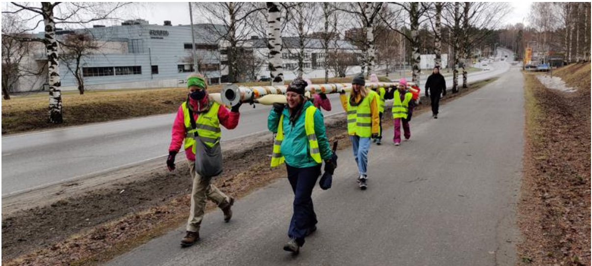
Kuva: Seikkailijajoukkue Ryhävalaat vuorollaan kantamassa lipputankoa