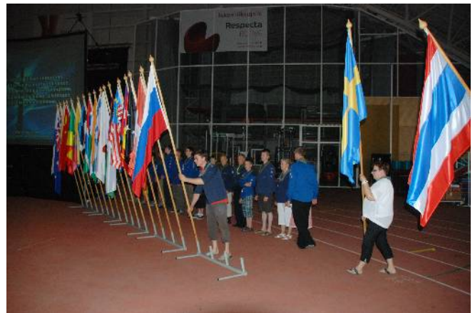
Kuva Viimeiset liput laitetaan paikoilleen

Versopartiolaiset kantoivat jälleen lähetysjuhlan alussa lähetysmaiden liput salin etuosaan.