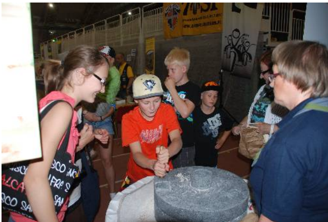
Kuva Jauhamaa kävi nuoria yhtä lailla

Versojen Kantokilta järjesti kesäjuhlille hienosti käsijauhinkivet lauantaiksi 29.6., jolloin paikan päällä sai jauhaa jyvistä omia jauhoja. Saadut rahalahjat menivät versotyön tukemiseen.